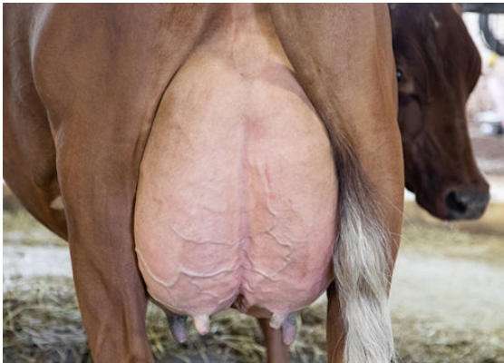
LA CROISEE AMAZING FLICKA