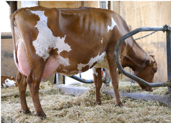
DES RASADES AMAZING GABY DAUGHTER