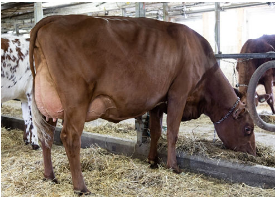
LA CROISEE AMAZING FLICKA